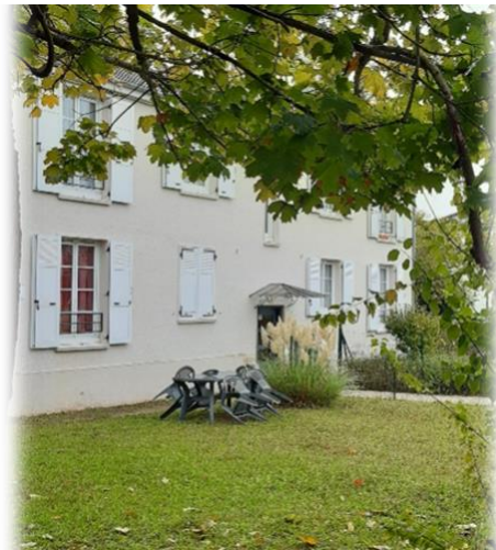
PAVILLON DE LA CITE-JARDIN DE LA PLAINE DE LA CHAMBRE